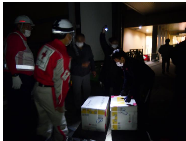
「救援物資を搬送する日本赤十字社職員（宮城県）」