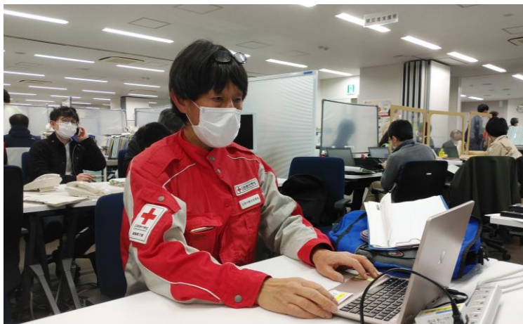
「県庁にて情報収集する日本赤十字社職員(福島県)」

(オ)活動内容 同府との協定に基づく、被災地方公共団体が実施する災害対応に関する支援等